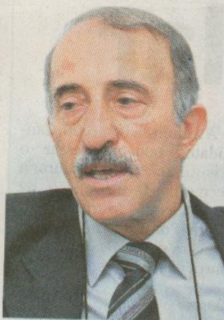
Salah é o presidente da Mesquita

“Este é um período importante de purificação da alma, onde