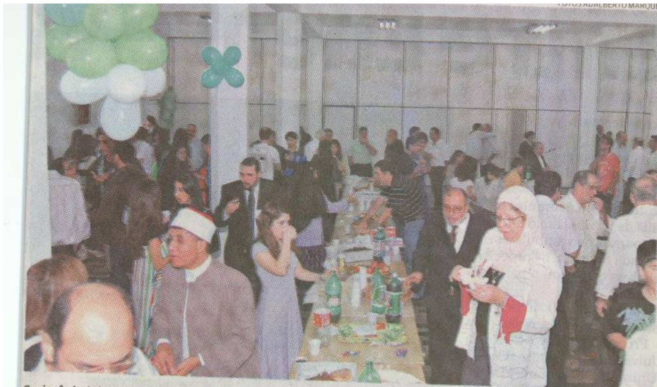
Cerimônia iniciada pela manhã foi marcada pelo desjejum dos seguidores da religião de Maomé

até proibida de entrar nas escolas e universidades. O mundo vai ter paz apenas quando tiver mais diálogo e respeito”, observou o presidente da Mesquita, fundada há quase 30 anos.