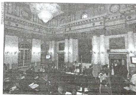
Em Santos, despesa com salários dos gabinetes seria de R$ 1,6 mi